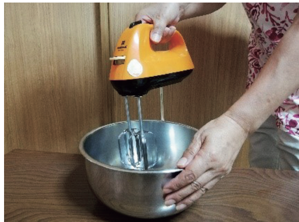
④材料をかき混ぜる