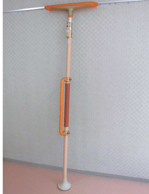
② 突っ張り棒型縦手すり