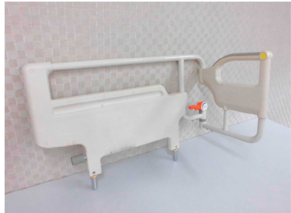
④ ベッド柵 (移動バー)