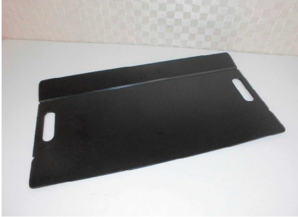
① スライディングボード